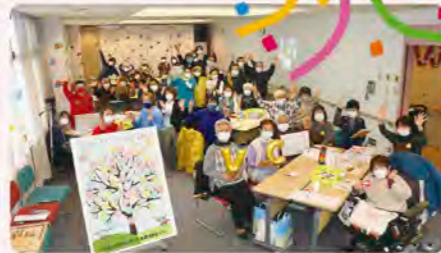
開設記念に参加者のみなさんとタペストリーを作りました!