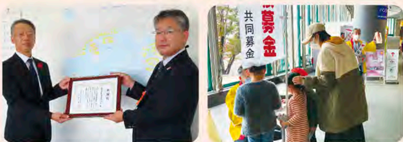
阪神国際港湾株式会社 咲州子どもEXPO 2021

10月1日から12月31日まで「赤い羽根共同募金」運動をおこないました。イベントでの街頭募金、戸別募金、区内小学校での学校募金、企業等からの団体募金、商店での募金箱設置などでたくさんの方々にご協力いただき、ありがとうございました。