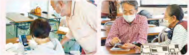
区社協主催のスマホ講座で「デジタルボランティア」にお手伝いいただきました!

「デジタルボランティア」略してデジボラ! スマホやパソコンなどの、「ちょっとしたこと」を優しく教えるボランティアです。デジボラさんとして活躍していただける方の登録をお待ちしております!