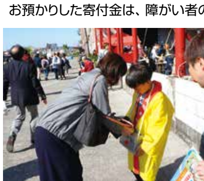
すみのエアート・ビート2018での募金活動の様子

お預かりした寄付金は、障がい者の作業所の整備や高齢者の配食サービス、子どもの居場所づくりなど、「地域福祉活動」への助成をはじめ、大規模な災害時には、被災地等で活動するボランティアやNPOのための支援金としても使われています。 今年も10月1日から共同募金運動が始まりますので、ご協力よろしくお願いします。