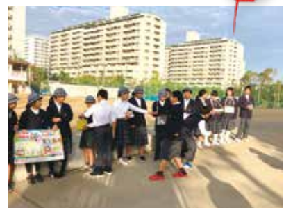
咲洲みなみ小中一貫校での募金活動の様子

昨年10月1日から12月31日まで、「赤い羽根共同募金」運動が行われました。各地域での戸別募金をはじめ、イベントでの街頭募金、区内小・中学校での学校募金、企業などからの団体募金など、様々な方々からご協力いただき、合計4,724,335円の寄付金が集まりました。