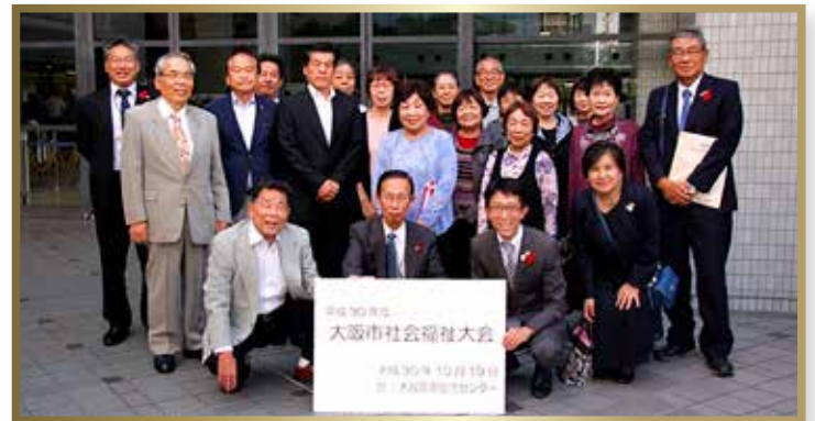
住之江区で表彰・感謝状を贈呈された個人・ボランティアグループの方々(敬称略)

10月19日(金)、大阪市社会福祉大会が大阪国際交流センターで開催され、地域福祉の推進に貢献された方々に、大阪市長及び大阪市社会福祉協議会会長から表彰状並びに感謝状が贈られました。