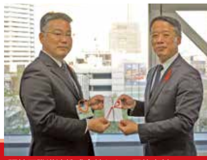
阪神国際港湾株式会社からの団体寄付