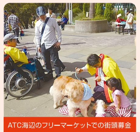
ATC海辺のフリーマーケットでの街頭募金