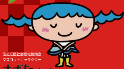
住之江区社会福祉協議会 マスコットキャラクター さざなみっちゃん