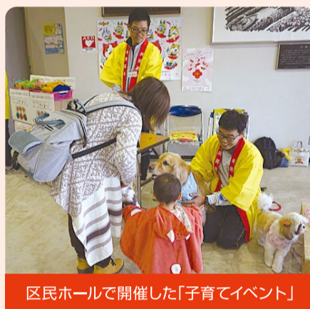
区民ホールで開催した「子育てイベント」