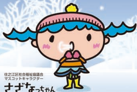
住之江区社会福祉協議会 マスコットキャラクター さざなみちゃん