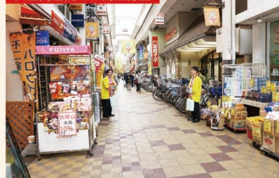
安立商店街での街頭募金