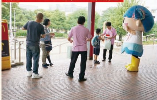
南港ポートタウン東駅での街頭募金