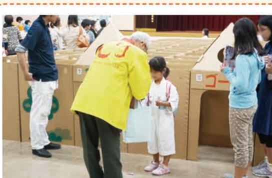
区民ホールで開催した「子育て応援イベント」