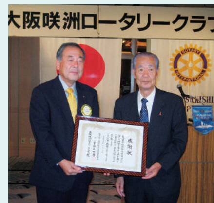
大阪咲洲ロータリークラブ 寄付金贈呈式

今年も「大阪咲洲ロータリークラブ」より、創立19周年記念例会の10月8日(水)に、金一封を預託いただきました。ありがとうございました。