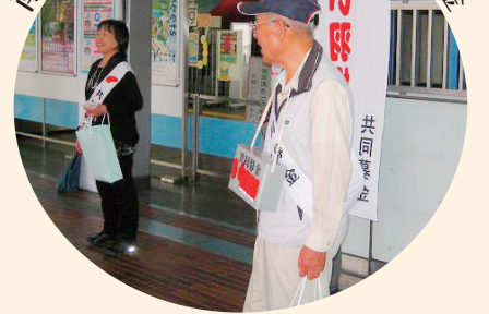
南港ポートタウン東駅での街頭募金