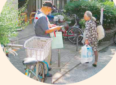
粉浜商店街入口前での街頭募金