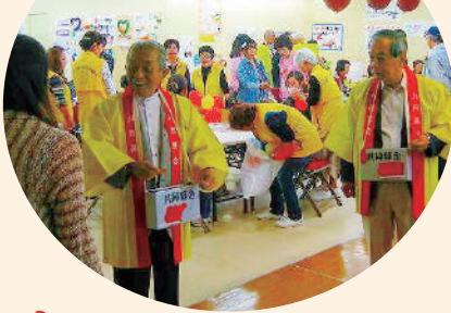
子育て応援イベントでの街頭募金