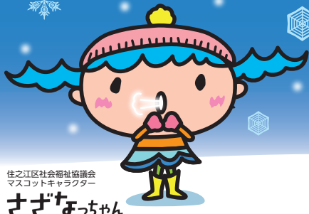
住之江区社会福祉協議会 マスコットキャラクター さざなみちゃん