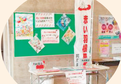
共同募金のコーナーを設置