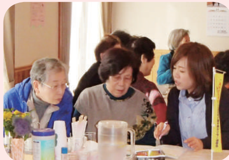
ふれあい喫茶での出前相談

地域包括支援センターも新北島ランチも、来所での相談に限らず、お電話や訪問での相談もお受けしていますが、出前相談もどうぞお気軽にご利用ください。